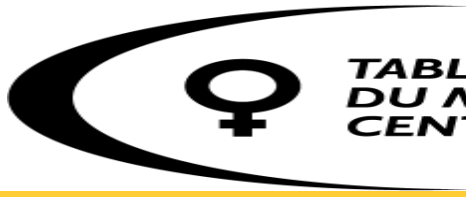
TABLE DE CONCERTATION DU MOUVEMENT DES FEMMES CENTRE-DU-QUÉBEC