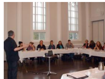
Quelques participantes à la formation.

La journée voulait aussi nous permettre de connaître des besoins précis de formation de nos membres. Deux formations, plus générales, sont ressorties, l'une sur la santé mentale positive avec l'intégration de l'intervention féministe, une autre sur les 4 enjeux du développement et la compétence affective. Des formations plus pointues ont été aussi demandées, entre autres sur l'intervention en milieu de vie. En septembre, le comité verra comment donner suite à ces demandes.